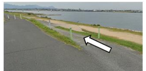
緑のポールがある道を下り河川敷へ