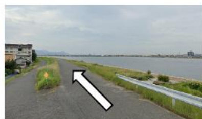
土手沿いを河口方向へ走る