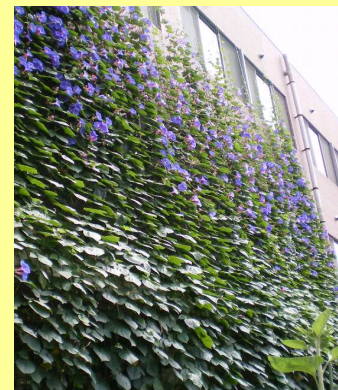
▲しげい病院の緑のカーテン