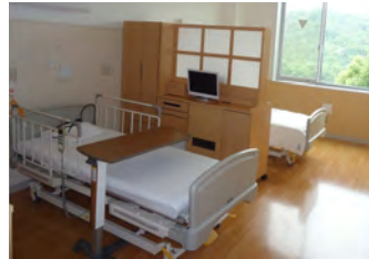
・ 2床室 A