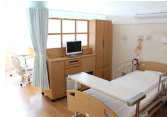
・ 2床室 B